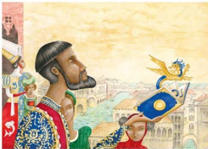
Illustrazione di Michelangelo Rosseto tratta dal libro "Marco Polo" edizioni ARKA 2024